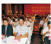
市领导与台湾嘉义长庚纪念医院代表在会谈中合影

市委、市政府及市卫生局高度重视市人民医院与嘉义长庚纪念医院建立长期交流合作关系。此前市领导亲自率团到台湾考察长庚医疗体系并进行对接工作,提出了“对接专科、对接管理、对接劳务事业”的合作战略;第十一届赣台经贸文化交流大会期间,市领导专程会见了台湾嘉义长庚纪念医院的客人,台湾保健全民健康保障有20多年时间,在全体居民提供疾病预防、诊断治疗、健康教育等医疗服务,对我市疾病保障方面有一定借鉴意义,对我市医疗体制改革具有重要的借鉴意义。市人民医院愿以此为契机,加强学科建设,提升内涵建设;并提出了要以市人民医院为龙头,在全市逐步建立分级诊疗模式,为群众提供安全、有效、方便、价廉的医疗卫生服务。不仅如此,市领导在调研中多次希望市人民医院在对接名称、名校上下功夫,从而提升高医疗水平来保障市民健康。