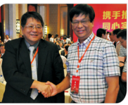
嘉义长庚纪念医院代表与市人民医院代表在会谈中合影