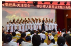
临床第一、四支部演唱《白金十分钟》