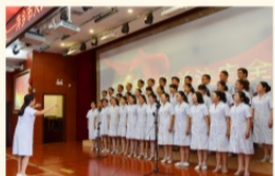
临床第二、三支部合唱改编歌曲《平安之歌》