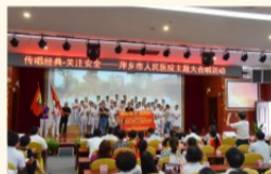
临床第一、四支部演唱《白金十分钟》