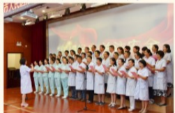
临床第二、三支部合唱改编歌曲《平安之歌》

此次活动的开展，在全院掀起了弘扬爱党、爱国、爱院主旋律最生动的教育氛围，既重温了萍医经典，提升安全理念这个不容忽视的重要话题，同时增强了各党支部的凝聚力和战斗力。党员干部们用歌声重温了难忘的岁月，用熟悉的旋律演绎了萍医新时代的风采。