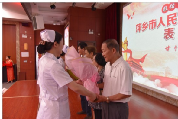
护士们为“普爱纪念章获得者”医德高尚，医者仁心，医术精湛的老前辈们献上了鲜花

会前，临床管理部组织50位医师代表进行了首个医师节宣誓仪式，庄严肃穆的重温了《中国医师宣言》，体现萍医人践行“敬佑生命，救死扶伤，甘于奉献，大爱无疆”精神。