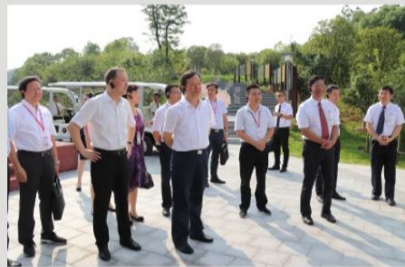
与会人员在医院健康公园参观