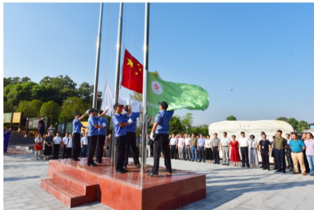
萍乡市人民医院举行健康文化公园开园揭牌仪式