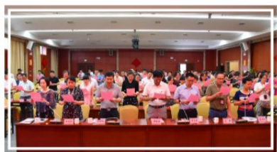
全场集体诵读：方志敏《可爱的中国》

为纪念中国共产党成立97周年，传承红色基因，不忘初心使命，7月2日下午，我院举办了“七一”表彰大会暨“红色家书诵读”活动。