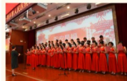
机关一、二支部和康桥体检分院支部合唱

大合唱活动在各党支部的精心组织下，人人参与，展示了昂扬向上的萍医精神面貌，全院14个党支部用独具匠心的演唱形式、各具特色的服装造型和大气磅礴的歌声、旋律歌颂了萍医人继往开来、阔步向前，昂首迈进新时代的豪情壮志，更唱出了在新时代对萍医的热情讴歌，歌声催人奋进，气氛振奋人心。