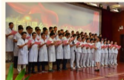
机关一、二支部和康桥体检分院支部合唱