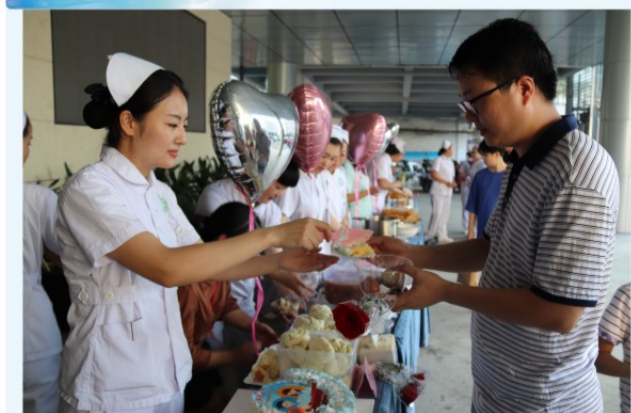
护士们给医生送上精心准备、亲手烹制的暖心早餐