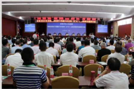
全省卫生计生系统贯彻省委十四届六次全体(扩大)会议精神专题研讨班现场会在院第一学术报告厅召开

新跨越”总体要求和建设“五个新萍乡”工作部署，充分树立“人民至高无上，患者是我亲友”服务理念，结合进一步改善医疗服务行动有关要求，周密安排、突出重点、整体推进，不断提升医学温度，大力拓展服务维度，有效提升服务能力，大幅提高患者满意度，为全市人民群众的健康保驾护航。